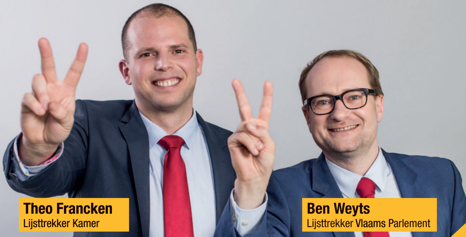
Theo Francken Lijsttrekker Kamer